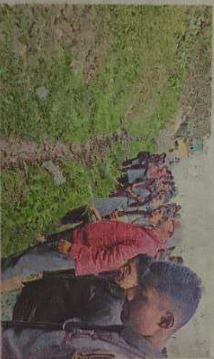
विश्व आद्रभूमि दिवस के उपलक्ष्य में विद्यार्थियों ने भ्रमण किया।